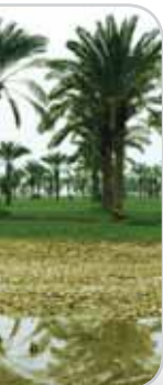
پنر و شیبی

جلگه خوزستان از نظر خاک‌های غنی و معدن‌های فراوان هم مشهور است. مهم‌ترین معادن نفت کشورمان در استان خوزستان قرار دارند. قدیمی‌ترین پالایشگاه نفت کشور در آبادان تأسیس شده است